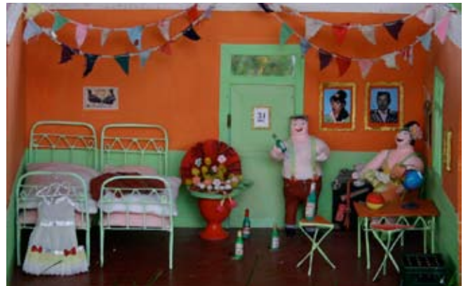
På pensionatet, ca. 30 x 40 x 25 cm Pap, papir, stof og ståltråd

Dukkehusene har været udstillet flere gange i forskellige sammenhæng. Nogle har været brugt som bogillustrationer og nogle har været brugt kulisser i dukkefilm.