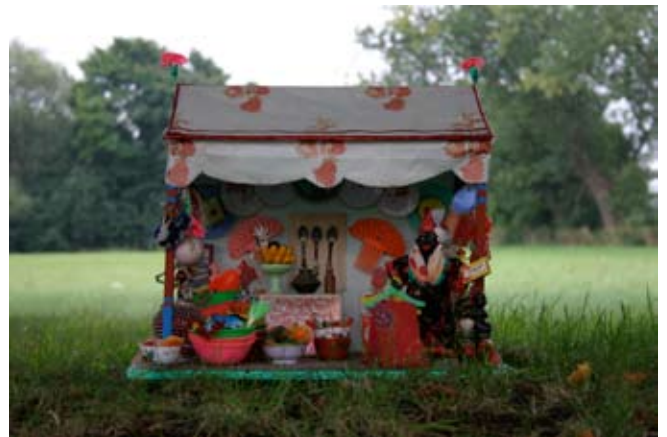
Isenkræmmer, ca. 30 x 40 x 25 cm Træ, papir og småting af plastic.