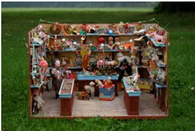
Herold's Varehus, ca. 30 x 40 x 25 cm Pap, papir og småting