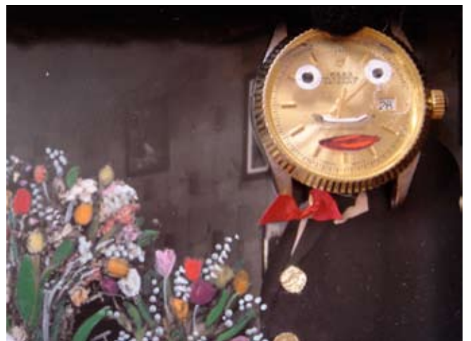
I de 4 hjørner er detaljer fra andre urbilleder fra udstillingen ‘Tidsrum’ i Toldkammeret, Helsingør 2008. Diverse ure og skrammel.