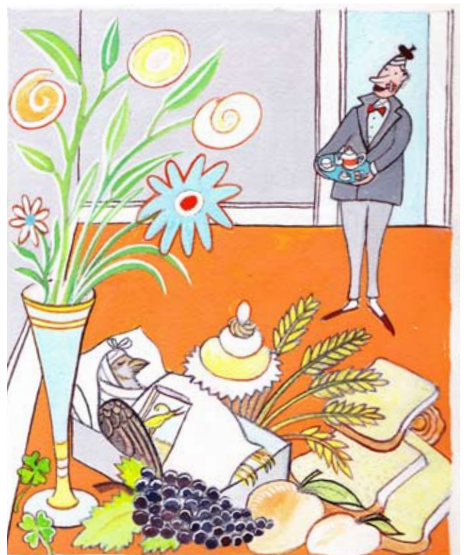
Illustrationer fra min næsten færdige billedbog der handler om en professor, hans vidunderlige maskine og hans lille ven - en gråspurv.