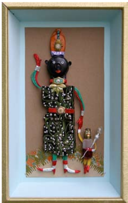
“Kontakt” ca. 46x29 cm. Kontakt, pærer, ure og printplade 2008