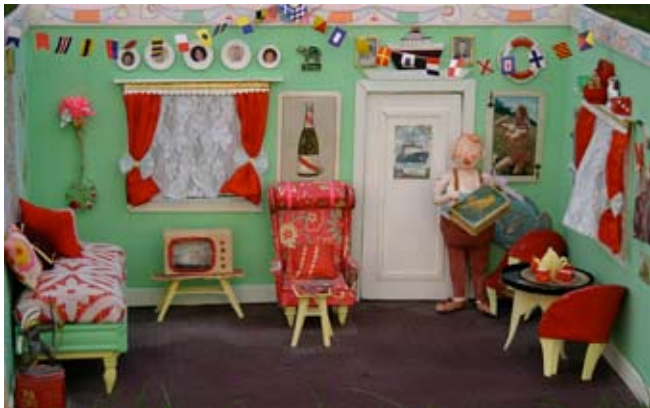
Hos sømanden, ca. 30 x 40 x 25 cm Pap og papir