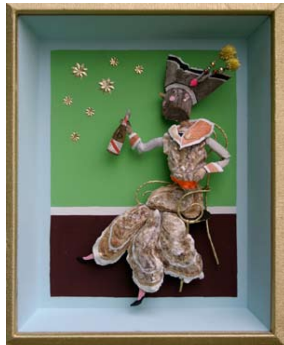
“Østers og Champagne” ca. 46x28 cm. Ståltråd, træ, østers og hummerskaller 2013

4 billeder trykt som postkort. 2 øverste: Foto: Julie Kyhl 2 nederste: John Lentz