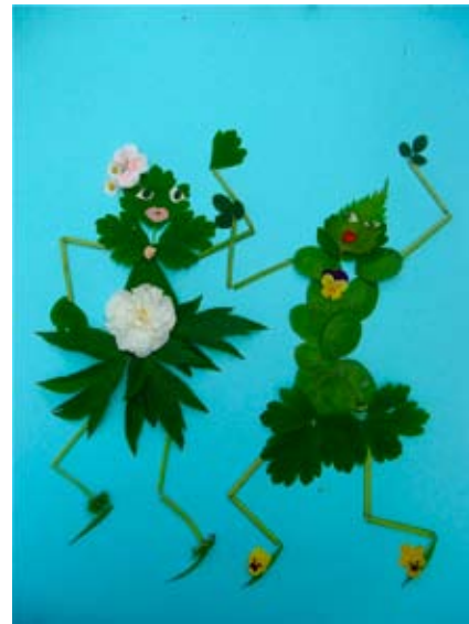
“Dansere i grønt” ca. 25x16 cm. Blomster og blade 2013