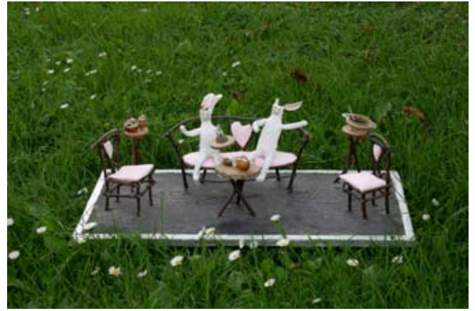
Kaniner til te, ca. 15 x 30 cm Møbler af grene og testel af nødder