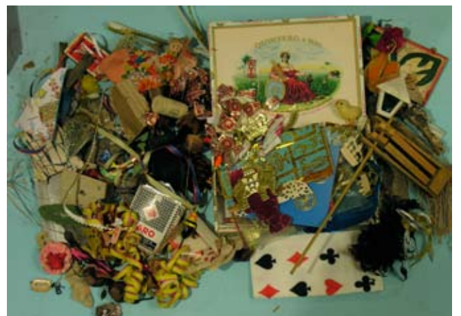
4 billeder af forskellige samlinger, der både fungerer som inspiration og som materialelager. I midten "Europæisk skovsvin", ca. 50 x 70 cm, lavet af landkort og små stumper skrald.