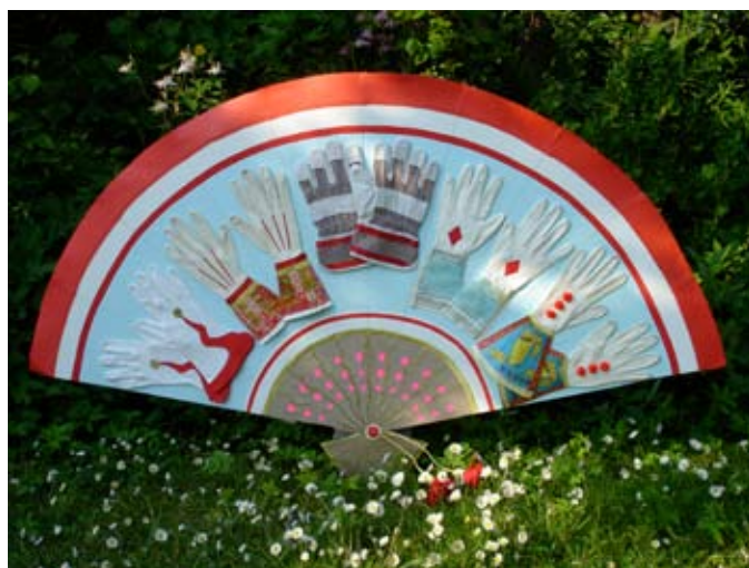
Hanske og sko vifter, ca. 80x45 cm. lavet til Zangenbergs Teaters garderobe. 2008 I midten: Dansepar, ca. 80x40 cm. Papmache ståltråd og crepe papir. 2010