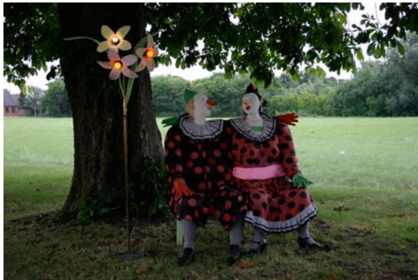
Øverst: "En sikker vinder" ca.22x36 cm. Træffis 2007 Foto: John Lentz Imellem: "Min stue" (model) ca30x50 cm. Lavet af papir pap og småting til filmen "Skidt eller skat, et blik på en kunstner" af Claus Lynggaard 2008. Forneden: Klovnesofa med blomster lampe, ca 120x100 cm. , skumgummi og stof på træstel, 2005 Foto: John Lentz