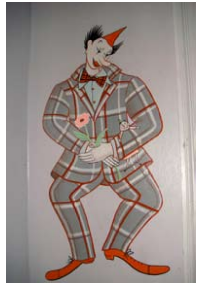
Dekorationer fra trappeopgang på Christianshavn. Figurerne måler ca. 120 cm. i højden. Malet direkte på væggene. 2004