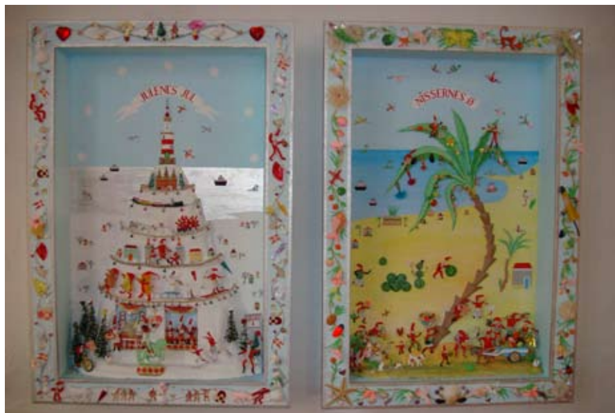
Øverst: indgangsportal til Gentofte Børnebibliotek, malet på træ 2011. Nederst: 2 tableauer, til børnenes u-landskalender (DR), ca.42 x 30 cm, 2008 lavet af papir og småting.