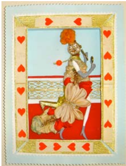
“Solkongen” ca. 22x13 cm. Ur, ørering, papir stof og spillekort 2013