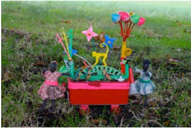
Legetøjsbod, 15 x 15 cm Madkasse og plasticting